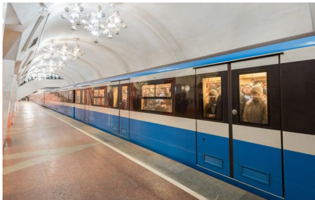
Фото: метро Харкова (facebook.com/metro.kh)

У неділю ввечері, 26 квітня, на одній із центральних станцій метро Харкова сталася стрілянина. Вогонь з пістолета відкрив чоловік, який був в стані алкогольного сп'яніння.