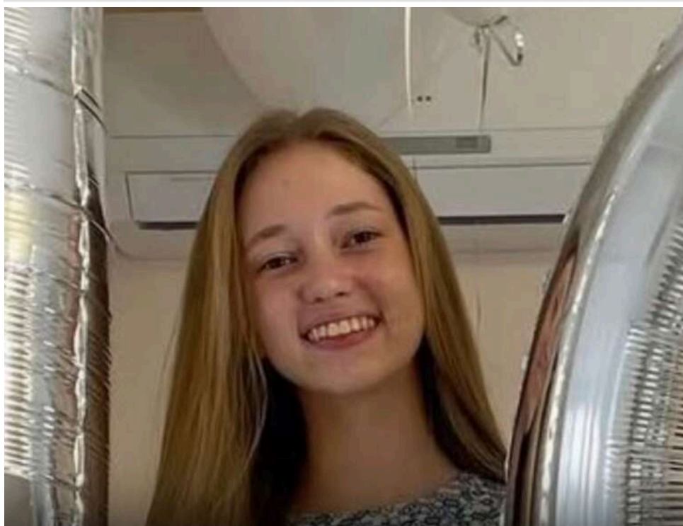
У Польщі під потяг потрапили дві школярки: українка загинула, полька у критичному стані

16-річна дівчина з України загинула на залізничній колії у містечку Маршев, що розташоване у північно-західній частині Польщі. Від отриманих травм дівчина померла на місці події. Її приятелька, 17-річна полька, перебуває у важкому стані.