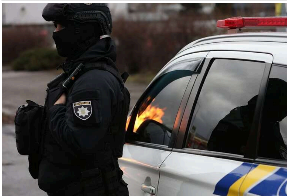
Обійшлося без постраждалих: у Харкові затримали зловмисника, що стріляв у повітря на станції метро

Стрільянина в Харкові: стрілка затримали, обійшлося без постраждалих.