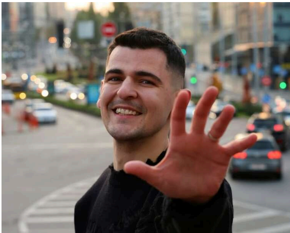
«Ризик паралічу був 50 на 50»: блогер Ніколас Карма переніс складну операцію на шиї після трирічних мук

Відомий український блогер Ніколас Карма, який прославився завдяки своїм роликам в TikTok з опитуваннями про ціну образів, переніс операцію.