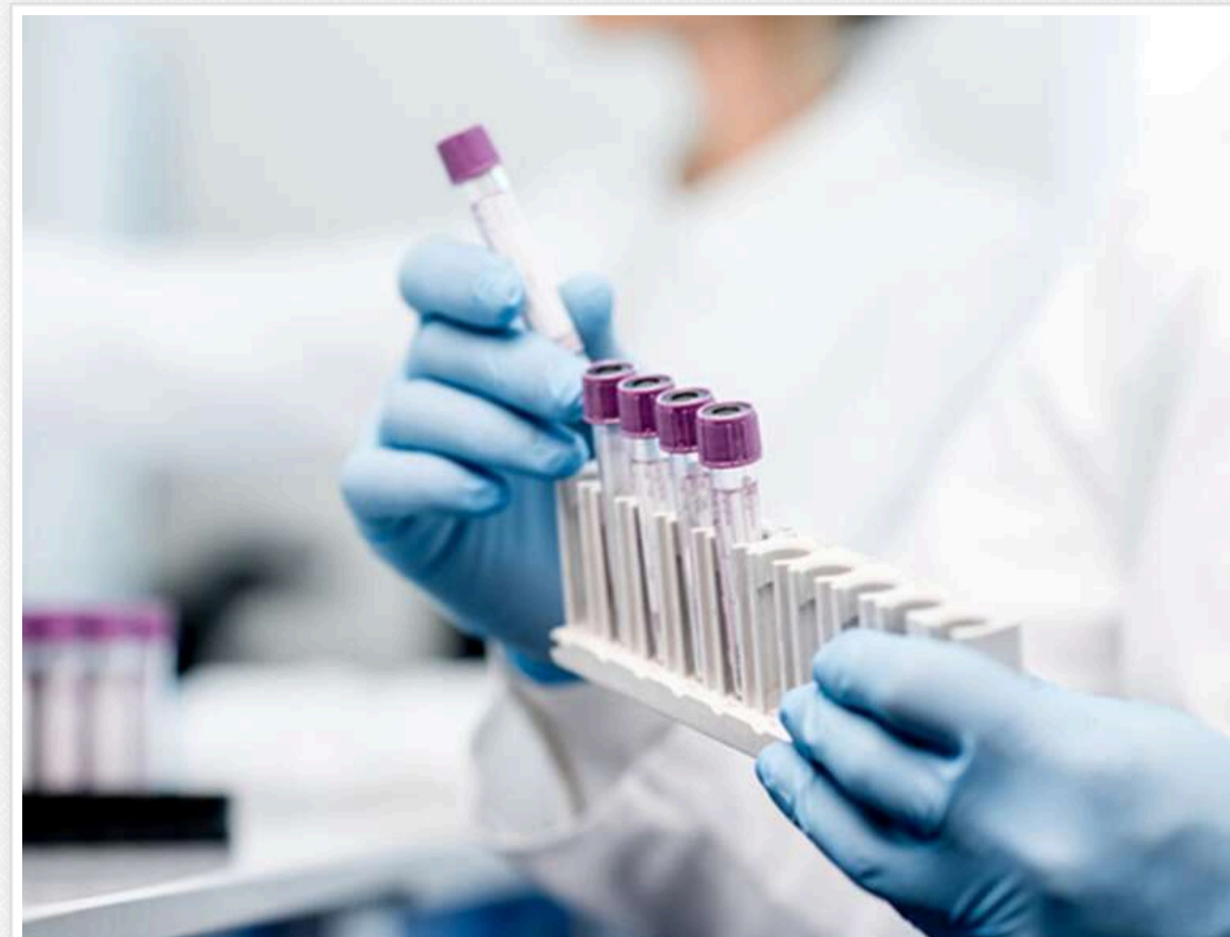
В Ізраїлі виявили хантавірус, який "передбачили" в соцмережах

В Ізраїлі зафіксовано перший випадок зараження хантавірусом у пацієнта, який відвідав Східну Європу, – The Jerusalem Post .