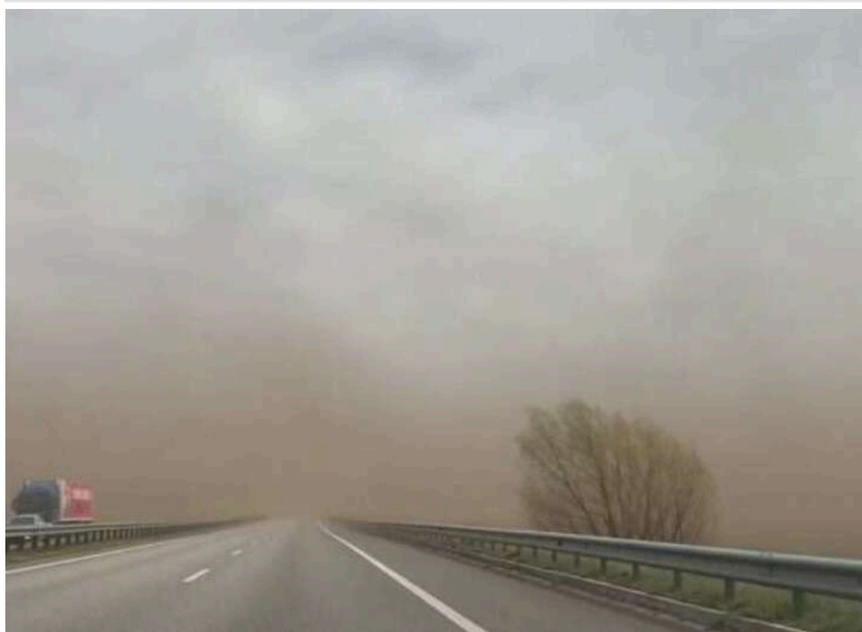
Видимість 20 метрів: трасу «Київ – Чоп» накрила потужна пилова буря, рух транспорту критично ускладнено

Траса Київ-Чоп опинилася в епіцентрі потужної пилової бурі, яка значно ускладнила рух транспорту на одній із головних магістралей країни.