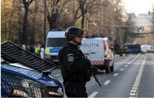
Фото: спецслужби Румунії виїхали на місце падіння чергового дрона

У повіті Тулча між населеними пунктами Лункавіца та Векерень виявили уламки безпілотнока. Наразі територію охороняють, а на місці працюють фахівці для проведення експертизи.