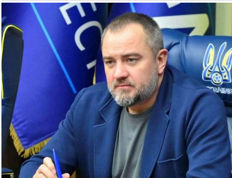
Справу Павелка та Запісоцького передано до суду: екскерівників УАФ звинувачують у розкраданні 40 мільйонів гривень

Офіс генерального прокурора передав до суду справу проти колишнього президента Української асоціації футболу Андрія Павелка та ексгенерального секретаря УАФ Юрія Запісоцького.