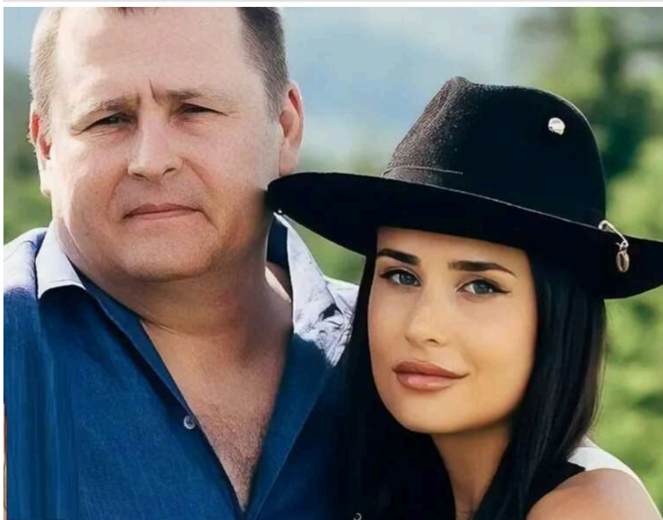
Вілла на Комо чи інформаційна атака: що відомо про «італійські активи» родини мера Дніпра Бориса Філатова