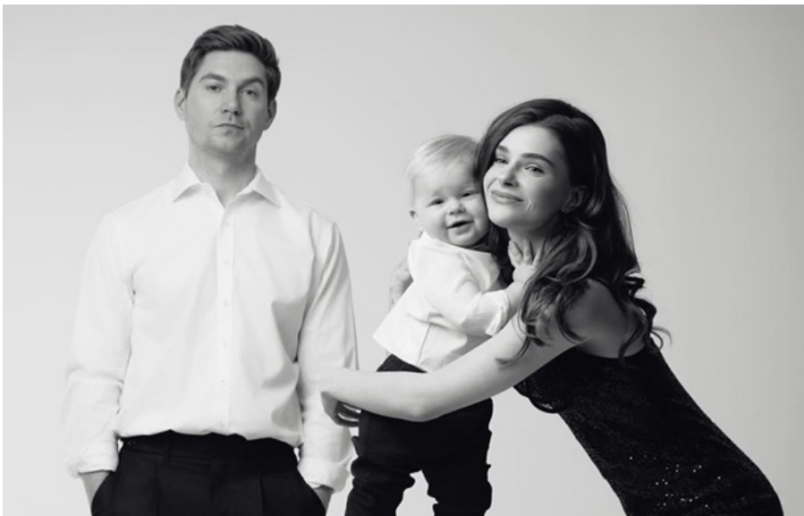
Сім'я Остапчуків

Подружжя підкреслює, що рішення про еміграцію є виваженим і продиктоване насамперед безпекою їхнього сина та майбутнім родини.