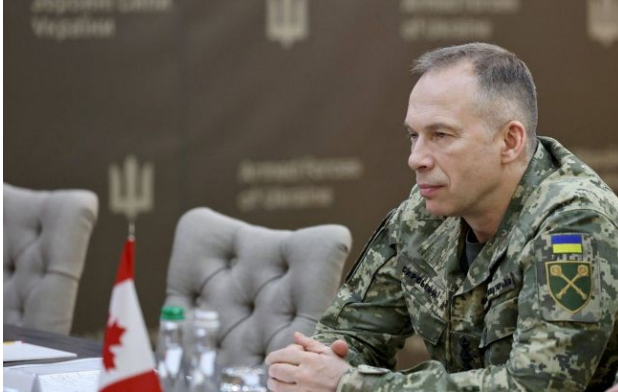
Фото: головнокомандувач ЗСУ Олександр Сирський (facebook.com/CinCAFofUkraine)

Російська протиповітряна оборона втрачає спроможність відбивати атаки безпілотників через брак ракет, що став наслідком точних ударів України.