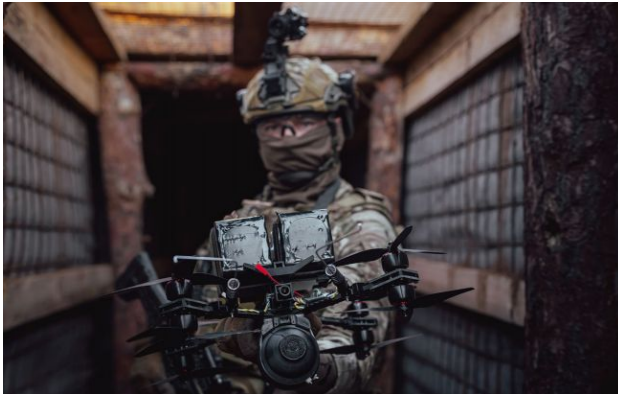
Фото: СБУ уразила низку важливих військових цілей у Криму

Служба безпеки України провела масштабну спецоперацію в окупованому Криму, уразивши три військові кораблі, винищувач та ключові об'єкти протиповітряної оборони РФ.