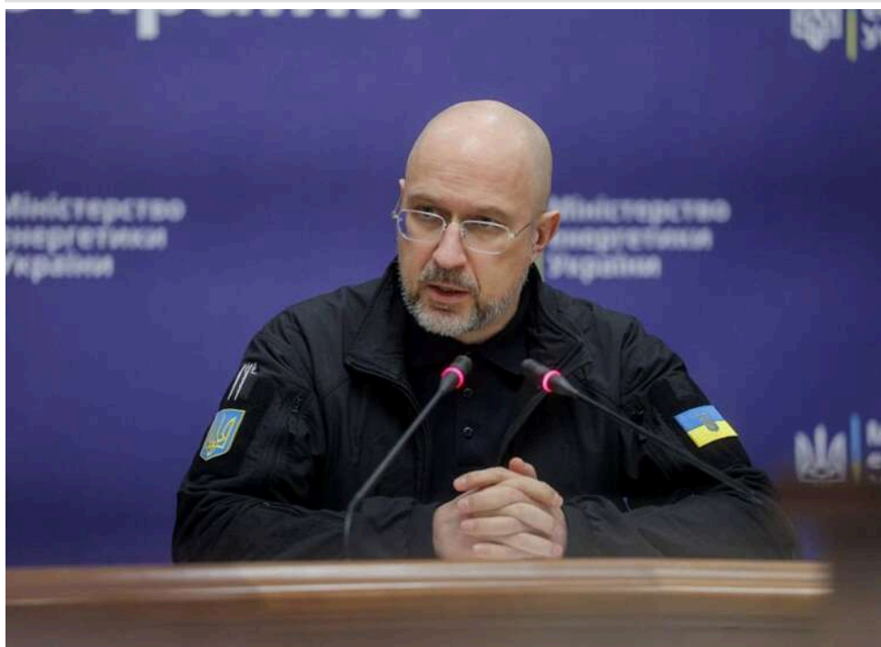
Запуск нафтопроводу «Дружба» може знизити ціни на дизель, – Шмигаль

Україна сподівається, що після відновлення транзиту нафти по нафтопроводу "Дружба" може поновитися імпорту нафтопродуктів з Угорщини, зокрема дизеля. І ціна на нього знизиться.