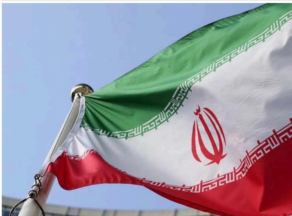
Іран спростував заяви Трампа про передачу ядерних матеріалів США

Іран офіційно спростував заяви Дональда Трампа про готовність передати ядерні матеріали Сполученим Штатам. Очільник МЗС звинуватив американського президента в маніпуляціях.