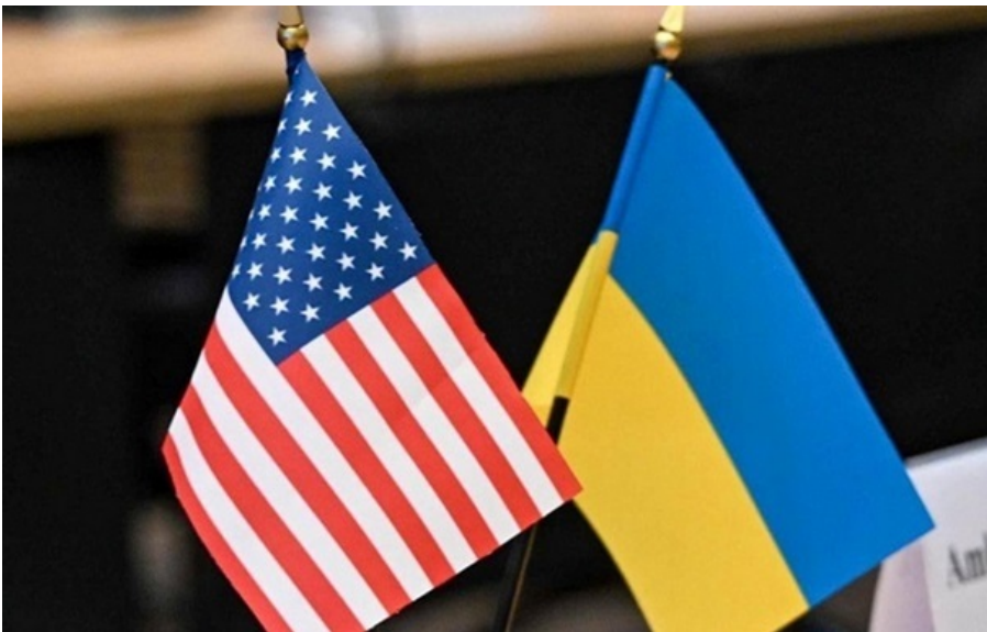
Фото: Rustem Umerov (ілюстративне фото) Україна - на постійному зв'язку з американськими партнерами

Україна на зв'язку з американською стороною - на постійному зв'язку на різних рівнях, підкреслив президент.