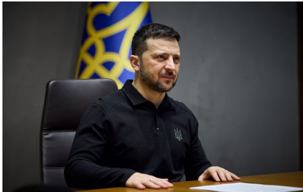
Фото: президент України Володимир Зеленський (president.gov.ua)

Україна візьме участь у саміті НАТО, який відбудеться в Туреччині. Наразі сторони узгоджують формат присутності та склад української делегації.