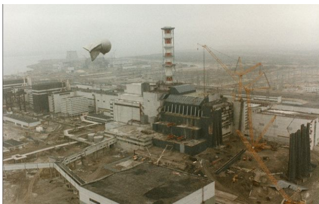
Фото: ЧАЕС після катастрофи (Getty Images)

У перші дні після аварії на Чорнобильській АЕС Радянський Союз намагався максимально обмежити доступ до інформації про радіацію - навіть лабораторії з вимірюваннями були закриті на кодові замки.