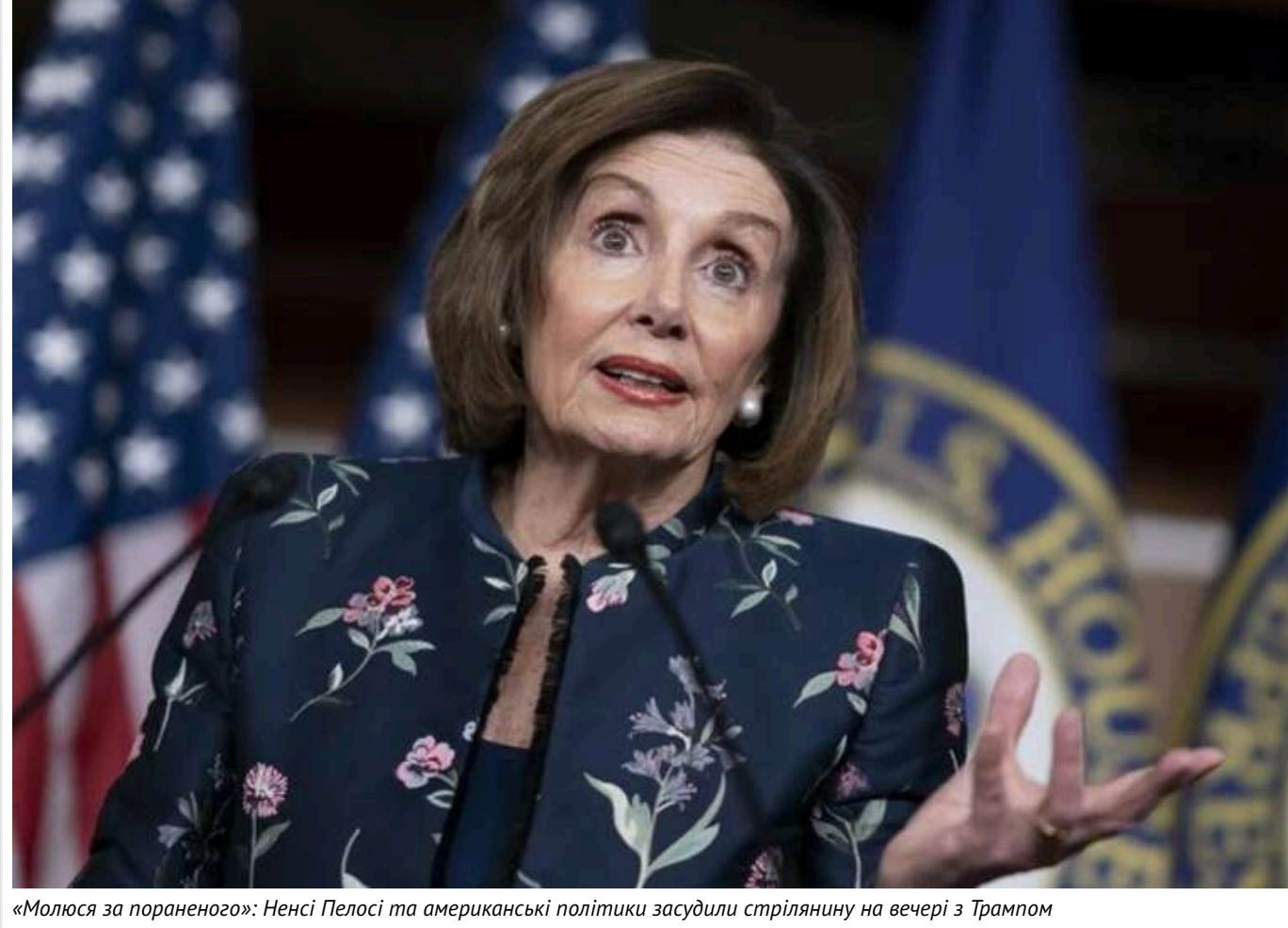
«Молюся за пораненого»: Ненсі Пелосі та американські політики засудили стрілянина на вечері з Трампом

Читати на руськом Додати як бажане джерело в Google