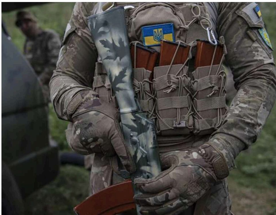
У полку "Скеля" заперечили причетність свого бійця до побиття побратима та назвали місце служби підозрюваного

425-й окремий штурмовий полк «Скеля» відреагував на розслідування стосовно побиття бійця 155-ї окремої механізованої бригади, яке напередодні оприлюднило видання «Слідство.Інфо». Журналісти повідомили, що за побиття затримано воїна «Скелі» з позивним "Карabas".