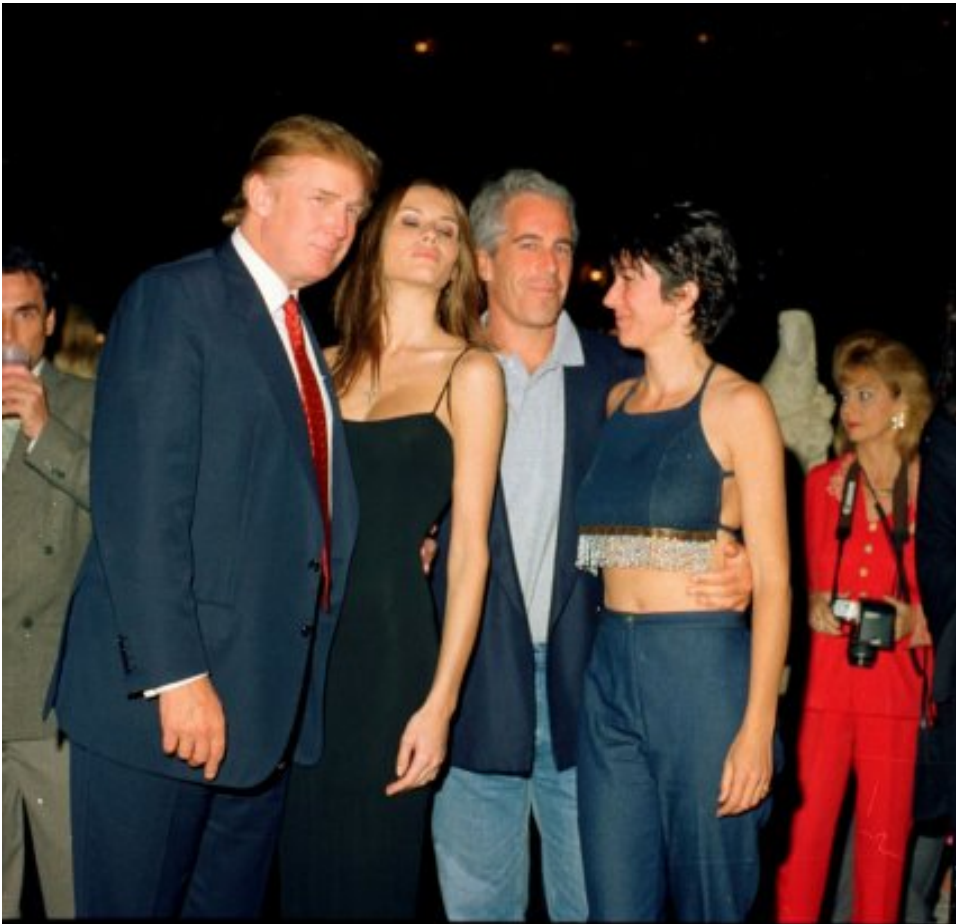
Дональд Трамп, Меланія Кнаус (у майбутньому Трамп), Джеффри Епштейн та Гіслейн Максвелл у лютому 2000 року

У 2004 році Замполлі за порадою Трампа зайнявся нерухомістю. Після чотирьох років роботи директором з міжнародного розвитку в Trump Group він заснував Paramount Group, компанію нерухомості, орієнтовану на дуже заможних клієнтів. Паралельно у ньому прокинулася дипломатична жилка. Починаючи з 2011 року Замполлі обіймав посаду посла Домініканської Республіки в ООН, а пізніше – посла захисту океанів. У 2021 році Джо Байден призначив його до Президентської ради зі спорту, охорони здоров'я та харчування.