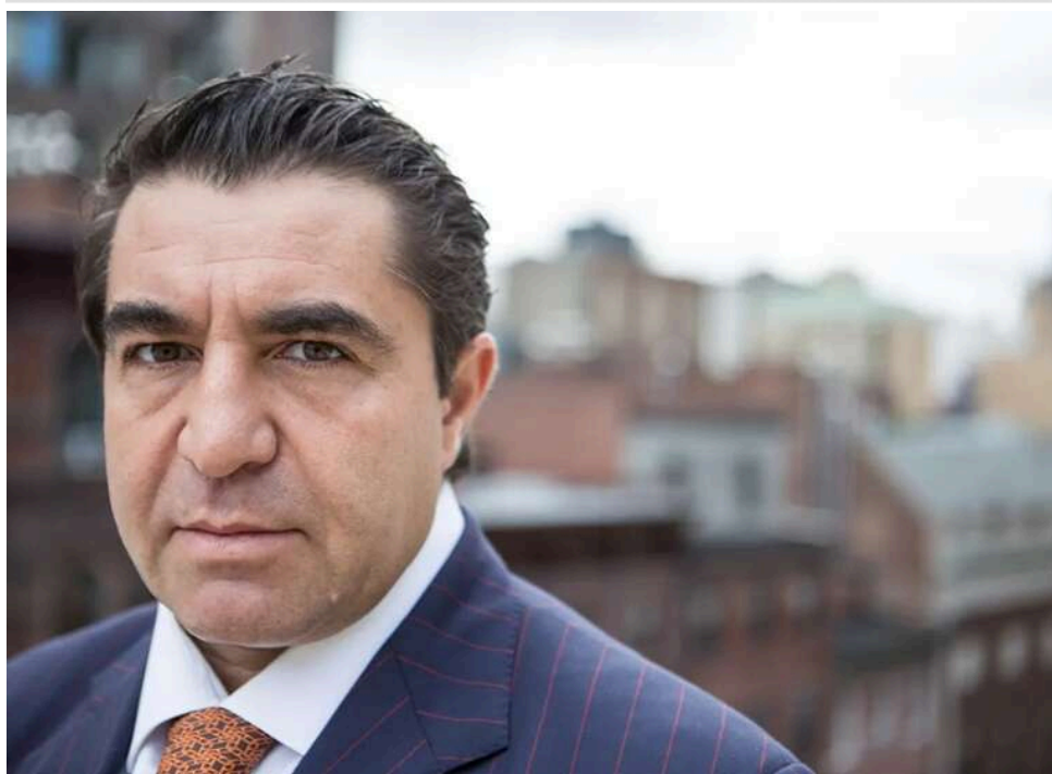
Паоло Замполлі закликав Трампа допустити Італію на ЧС замість Ірану

Спеціальний посланник президента США з глобальних партнерств Паоло Замполлі під час бесіди з Дональдом Трампом закликав главу Білого дому допустити збірну Італії на чемпіонат світу з футболу замість команди Ірану. Іранці офіційно поки що не відмовлялися від участі у Мундіалі, попри війну між країнами.