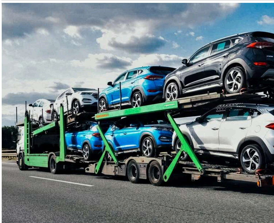
82 підроблені сертифікати: в Ужгороді оштрафували менеджера за масштабну схему імпорту "євроблях"

Мільйонні збитки від «євроблях»: менеджера фірми «ВЕЛКРАФТ» покарали штрафом за фальшиві польські сертифікати.