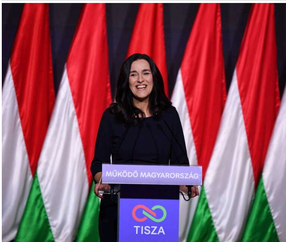
Сибіга привітав з призначенням нову главу МЗС Угорщини Аніту Орбан

Міністр закордонних справ України Андрій Сибіга привітав Аніту Орбан з призначенням на посаду глави МЗС Угорщини.