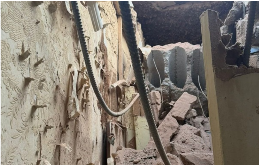
Наслідки удару по багатоповерхівці в Херсоні

До лікарні доставили дитину, яка постраждала через російські удари по Корабельному району Херсона близько 14:30.