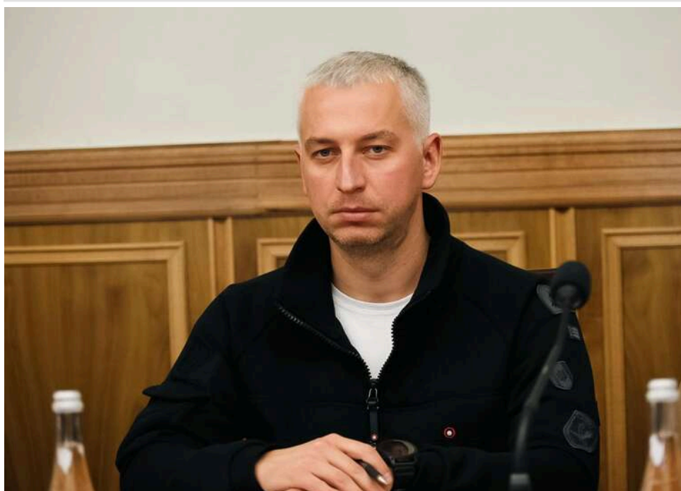
Porsche та котедж під Києвом: як сім'я заступника прокурора Хмельниччини Кутерги збагатилася під час війни

Максим Кутерга, 38 років, у вересні 2025 року призначений заступником керівника Хмельницької обласної прокуратури. До цього працював в МВС, Генеральній прокуратурі та Бюро економічної безпеки, де навесні 2025 року менш як місяць виконував обов'язки директора.