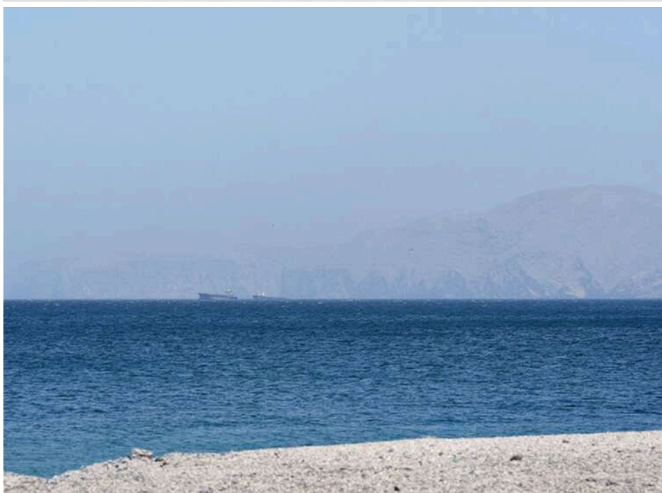
Нафтова деблокада: перші супертанкери пройшли Ормузьку протоку після перемир'я США та Ірану

Три супертанкери вперше подолали Ормузьку протоку з Перської затоки після домовленості про припинення вогню між США та Іраном.