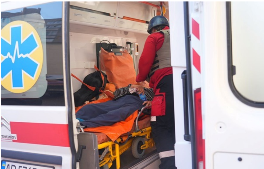
В Запорожье 19 пострадавших

Среди 19 пострадавших - несколько подростков. В частности, в тяжелом состоянии находится 17-летний парень с осколочными ранениями.