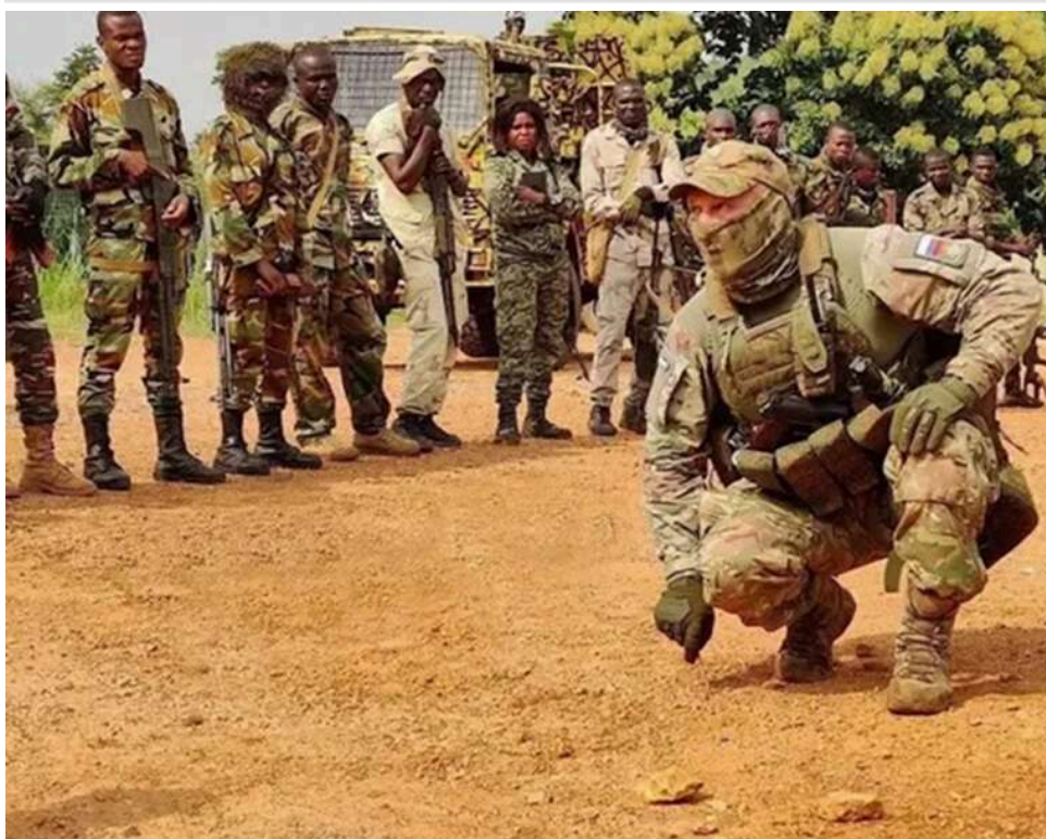
Африканський плацдарм Кремля: Росія відкрила в Того центр для дезінформації та вербування найманців

"Росотрудничество" спільно з АНО "Евразия" відкрило новий "російський дім" у Республіці Того. Проект позиціонується як гуманітарний, однак за культурною дипломатією приховані стратегічні цілі Кремля – поширення дезінформації та вербування до лав російської армії.