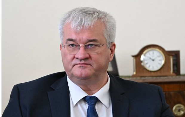
Фото: міністр закордонних справ України Андрій Сибіга (Getty Images)

Міністр закордонних справ України Андрій Сибіга засудив стрілянину, яка сталася під час вечері Асоціації кореспондентів при Білому домі у Вашингтоні.