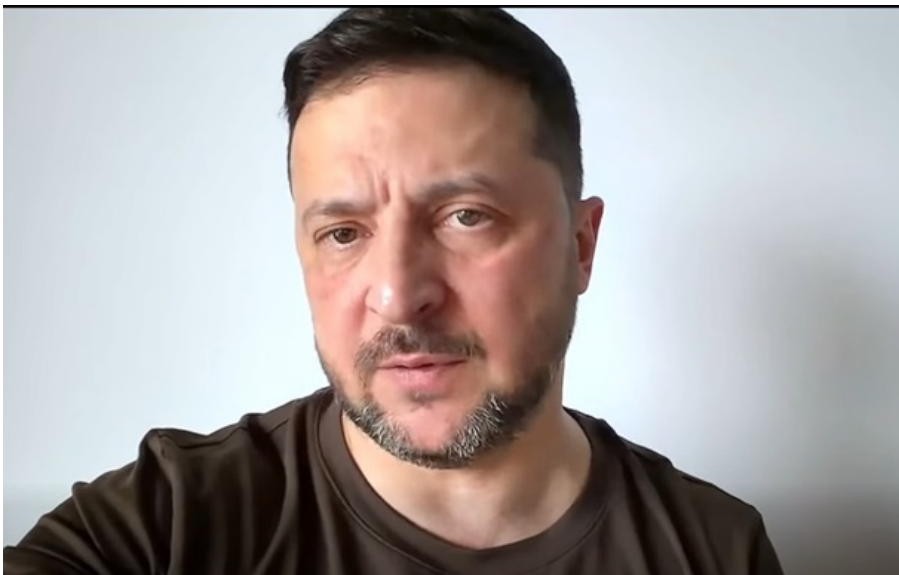
Фото: Кадр із відео Президент України Володимир Зеленський

Великдень має бути часом безпеки і миру, і було б правильно, щоб припинення вогню тривало й далі, сказав президент.