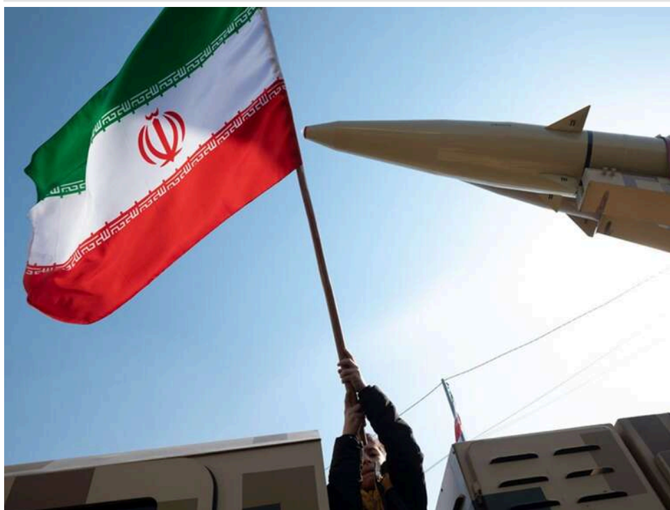
Іран зберіг 70% ракетного арсеналу та відновлює потужності після ударів США

За даними ЦРУ, Іран після американських ударів зберіг приблизно 70% довоєнного запасу балістичних ракет, пише The Washington Post з посиланням на джерела.