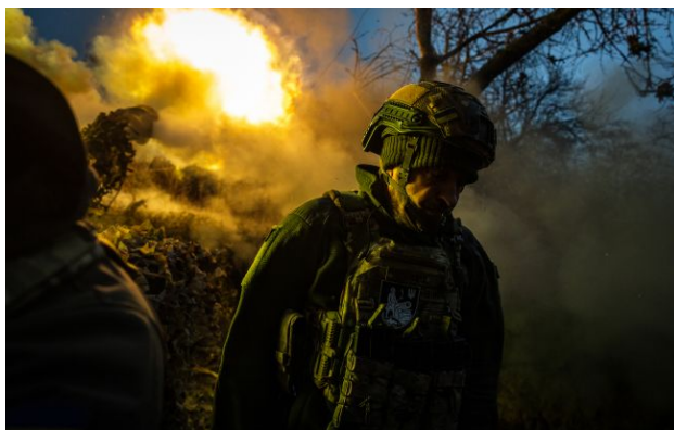
Фото: росіяни змінили тактику під Харковом і тиснуть на Покровськ

Російські війська продовжують наступальні дії одразу на кількох напрямках, намагаючись створити "буферні зони" та просунутися вглиб України. На Харківщині окупанти використовують нову тактику.