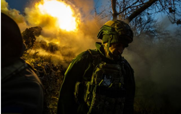
Фото: росіяни змінили тактику під Харковом і тиснуть на Покровськ

Обирайте перевірене - додайте РБК-Україна до улюблених джерел у Google