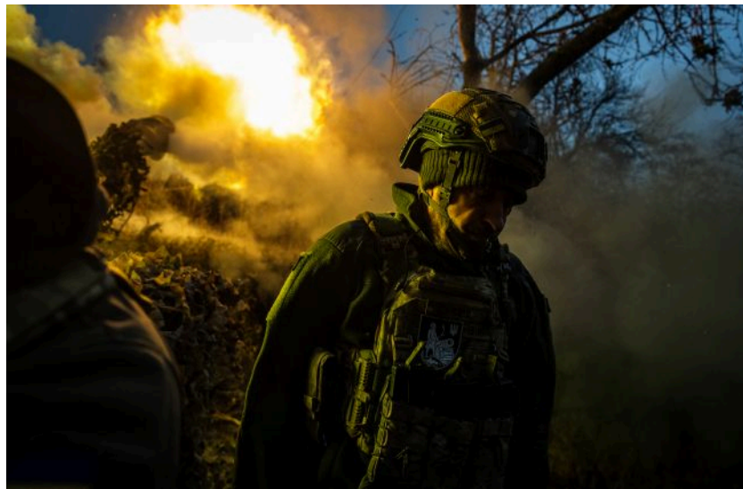
Фото: росіяни змінили тактику під Харковом і тиснуть на Покровськ