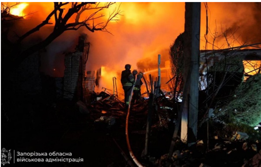
Запорізька обласна військова адміністрація

Пожар в Запорожье после российской атаки