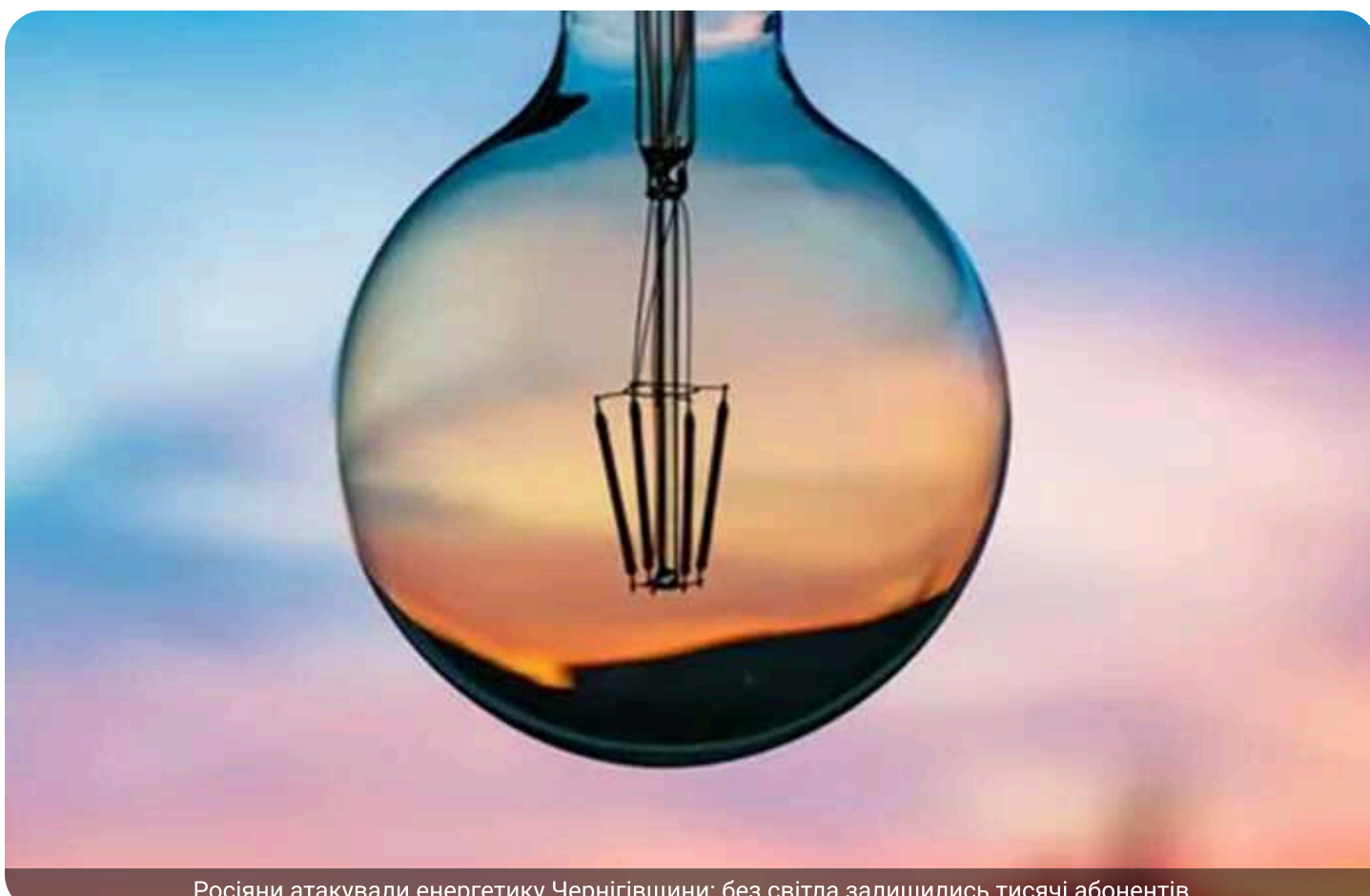
Росіяни атакували енергетику Чернігівщини: без світла залишилися тисячі абонентів

Вранці 18 квітня російська терористична армія завдала ударів по об'єкту енергетичної інфраструктури в Чернігівській області. Унаслідок атаки близько 380 тис. осіб залишилися без електроенергії.