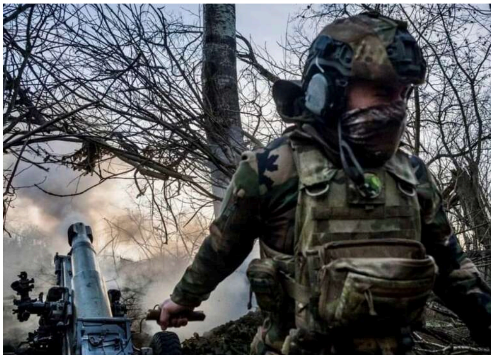
Ситуація на фронті: зафіксовано 151 бойове зіткнення за добу, Генштаб повідомив про найгарячіші напрямки фронту

Розпочалася 1515-та доба широкомасштабної збройної агресії РФ проти України. Загалом протягом минулої доби на фронті зафіксовано 151 бойове зіткнення.