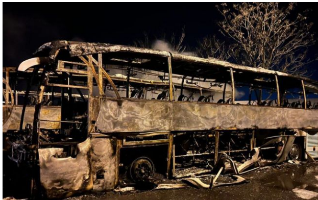
Фото: росіяни вдарили по порту та логістиці на Одещині (t.me/OleksiiKuleba)

Російські війська вночі 18 квітня завдали цілеспрямованого удару по портовій інфраструктурі та логістиці в Одеській області.