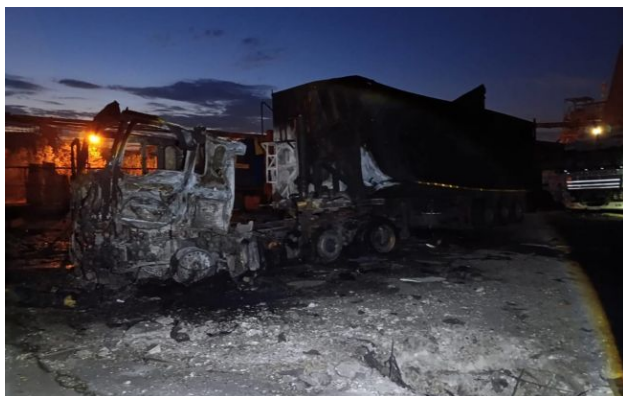
Фото: росіяни атакували портову інфраструктуру Одещини (t.me/odeskaODA)

Російські окупанти у ніч на 26 квітня атакували Одеську область ударними безпілотниками. Пошкоджено цивільну та портову інфраструктуру.