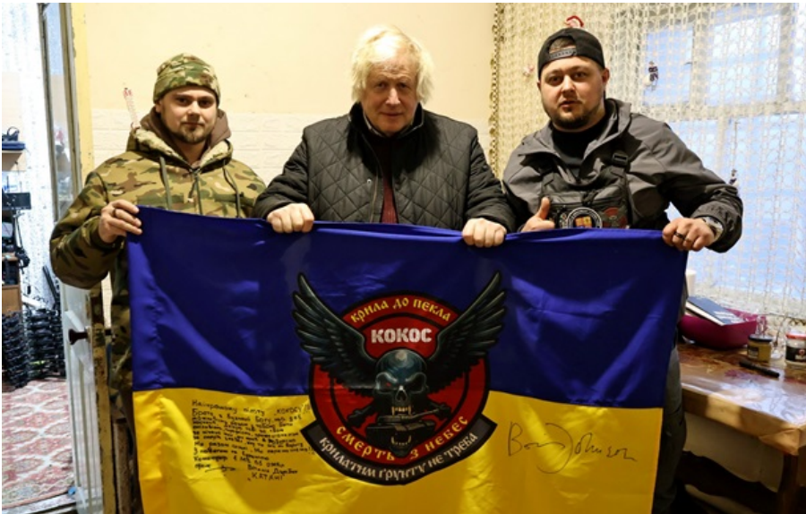
Борис Джонсон побував у Запорізькій області

Разом з британськими та українськими журналістами та українською групою супроводу Джонсон відвідав на Запоріжжі селище Комишуваха й ще три села.