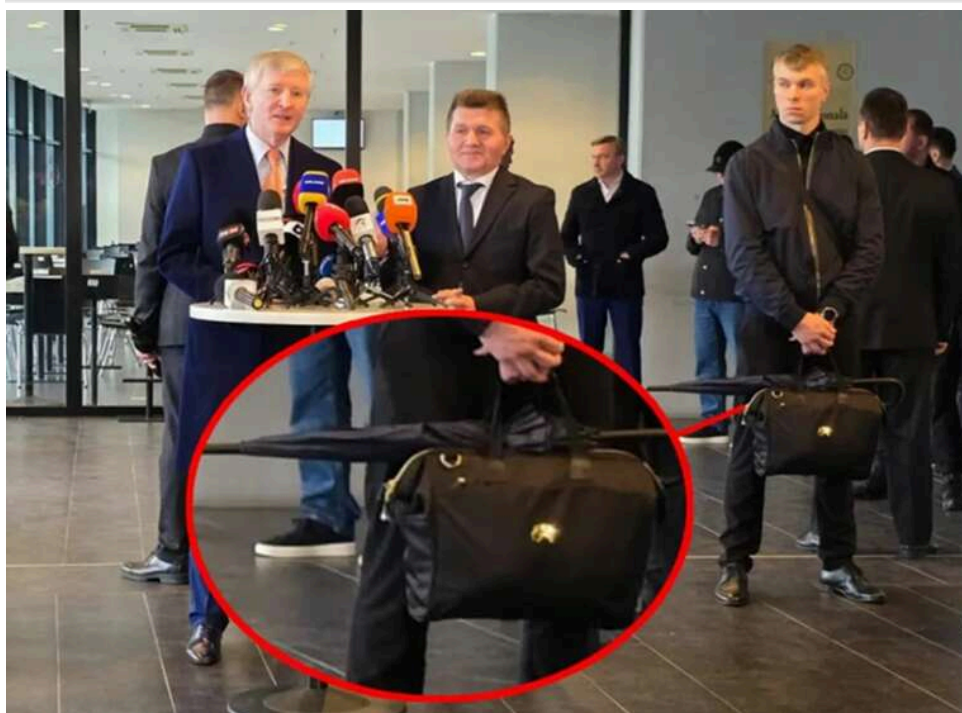
Прихована зброя та кевларові портфелі: як забезпечували безпеку українського мільярдера Ріната Ахметова в Румунії

Рінат Ахметов, президент «Шахтаря», нещодавно приїхав на церемонію прощання з Мірчею Луческу під посиленою охороною. Румунське видання Sapas.ro звернуло увагу на незвичайні аксесуари тілоохоронців українського мільярдера.