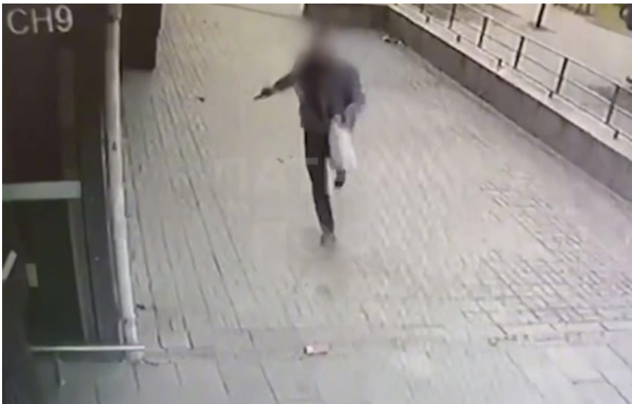
Позже СЗЧ-шника нашли мёртвым

На месте происшествия работают следственно-оперативная группа и представители Государственного бюро расследований. Назначено служебное расследование.