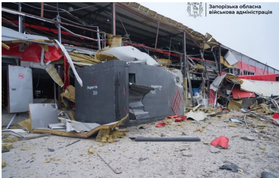
Запорізька обласна військова адміністрація