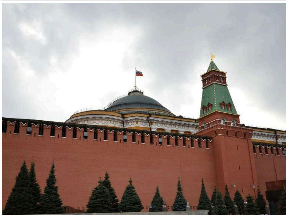
Удари по тилу змушують Кремль до вибору: ISW пояснив, як захист НПЗ підриває резерви РФ на фронті

Сили оборони продовжують завдавати далекобійних ударів по російському глибокому тилу. І їхню ефективність почали визнавати навіть у Кремлі: Москва задумалася про посилення ППО в регіонах, які опиняться під атаками України найчастіше.