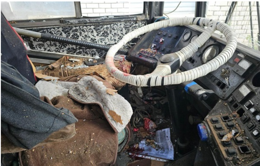
Кабіна тролейбуса, на який росіяни скинули вибухівку

Медикам не вдалося врятувати важкопораненого водія. Від отриманих травм він помер у лікарні, повідомив голова Херсонської ОВА.