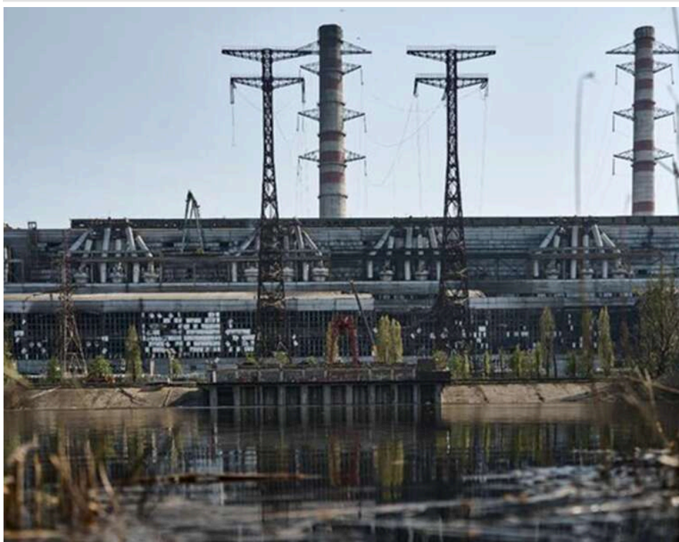
Розкрадання 50 мільйонів на Трипільській ТЕС: заарештовано майно та елітні авто ключового фігуранта Андрія Тесленка

Генеральний прокурор Руслан Кравченко нещодавно оголосив про викриття схеми привласнення понад 50 млн грн під час ремонту Трипільської ТЕС – колись найбільшого постачальника електроенергії для Київської, Черкаської та Житомирської областей.