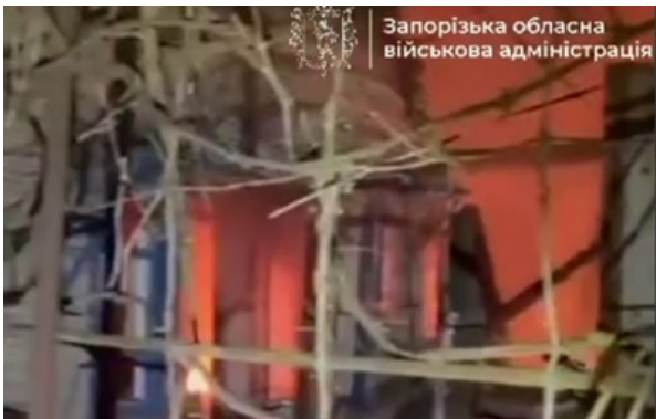
Росіяне нанесли два удара, в результате которых разрушены частные дома

В результате двух ударов погибла 30-летняя женщина, а 48-летний мужчина и 10-летний мальчик получили ранения.