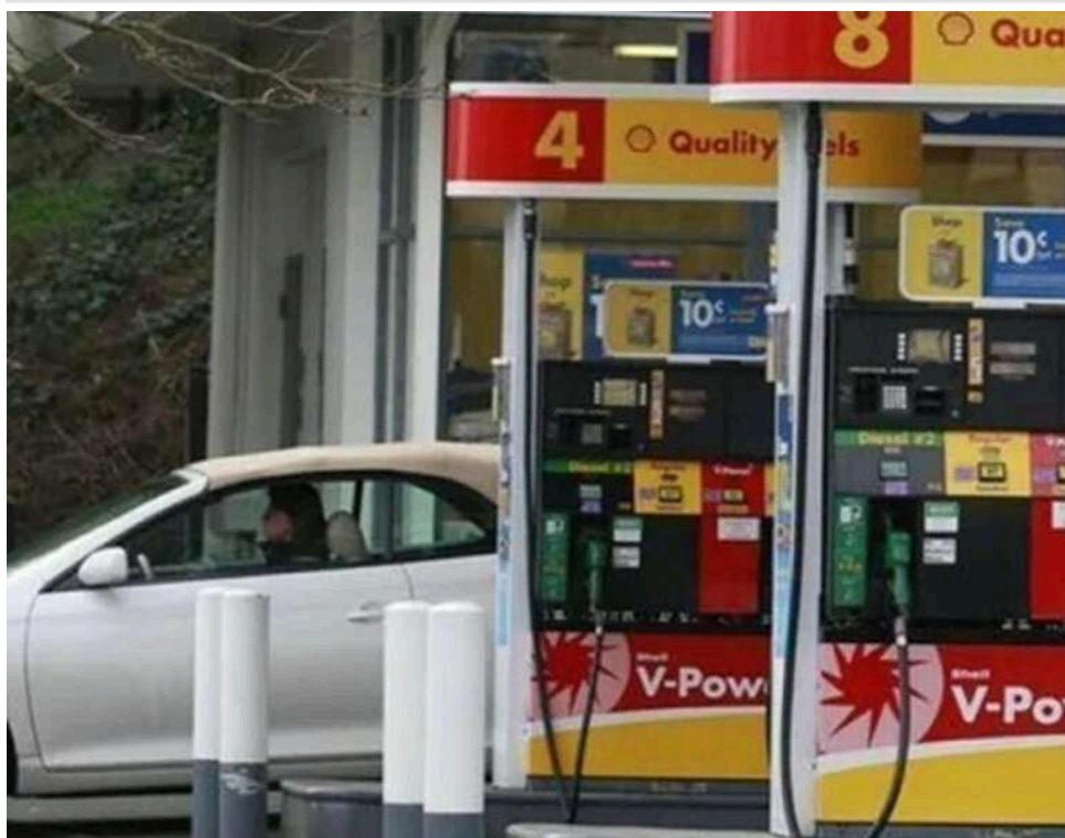
Бензиновий бумеранг: рекордна за 2 роки інфляція в США б'є по рейтингах республіканців

У США зафіксовано найвищу інфляцію за два роки через зростання цін на бензин.