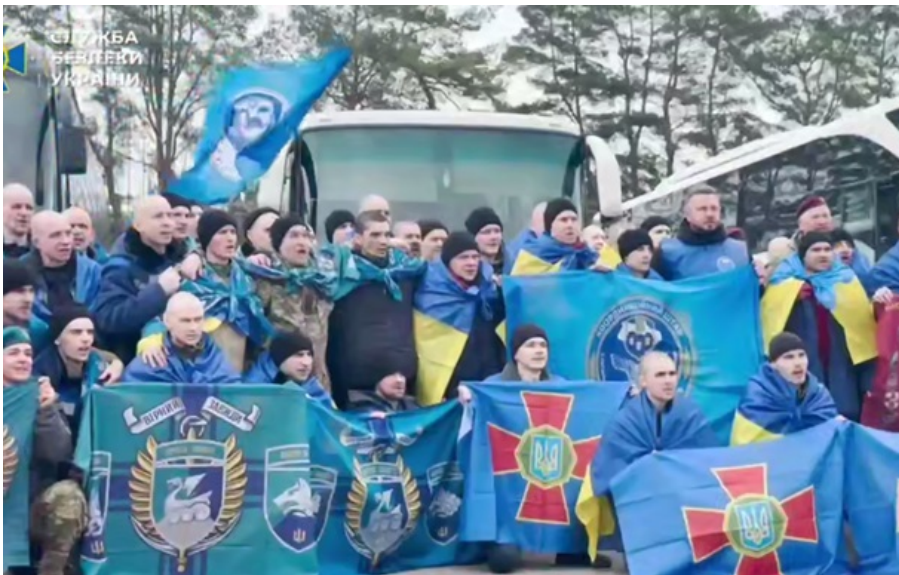
Фото: Кадр із відео Обмін полоненими 11 квітня

Сьогоднішній обмін - це результат роботи Об'єднаного центру з координації пошуку та звільнення військовополонених, Координаційного штабу з питань поводження з військовополоненими та інших уповноважених структур.