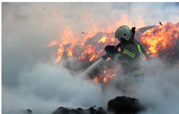
Фото: заграву видно задалеко від НПЗ (facebook.com/MCHSRussia)

У ніч на 26 квітня безпілотники атакували Ярославський нафтопереробний завод – одне з найбільших підприємств нафтопереробної галузі Росії.