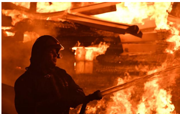
Фото: пожежники МЧС Росії (росЗМІ)

Вночі 26 квітня Севастополь атакували ударні безпілотники. Після серії вибухів у різних районах міста спалахнули пожежі. Окупаційний губернатор заявив про збиття 45 дронів.